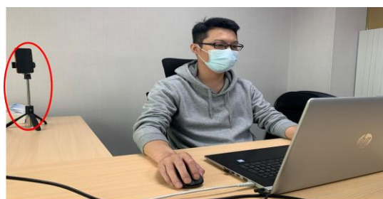
測驗期間需全程開啟視訊及麥克風，並將把手機放置於您坐定的座位斜後方的平台四點鐘或八點鐘方向