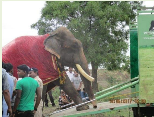
下圖：Gajraj 救援至大象保育中心

改變動物受苦的處境，除了動保組織發起連署救援動物的行動之外，更重要的是深耕動保教育工作的開展。教師則是透過教育現場引導孩童正確動物保護觀念與行動，翻轉動物受苦處境最重要的關鍵者。