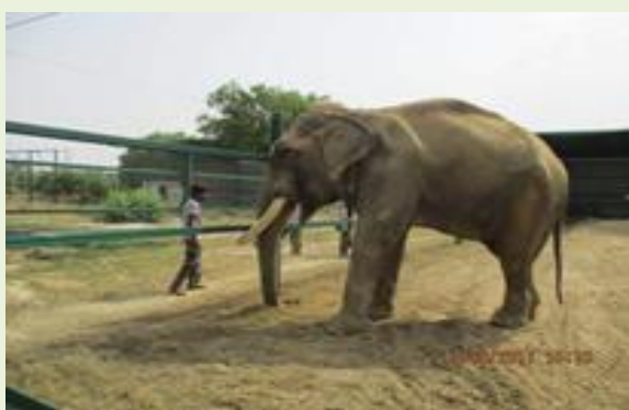
上圖：Gajraj 被鍊乞討受虐 51 年