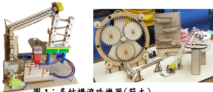
圖 1：多結構滾珠機器(範本)