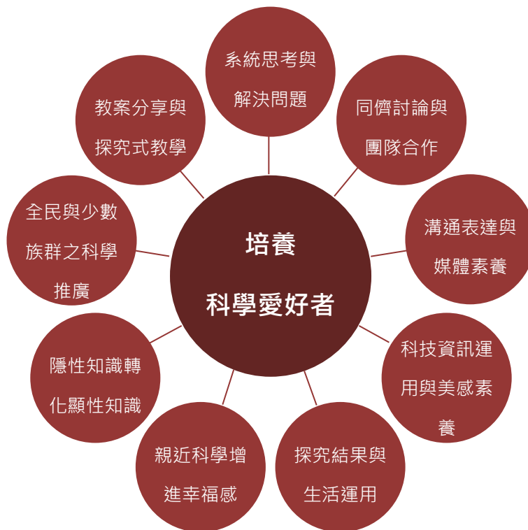
圖 1、全國科學探究競賽核心價值