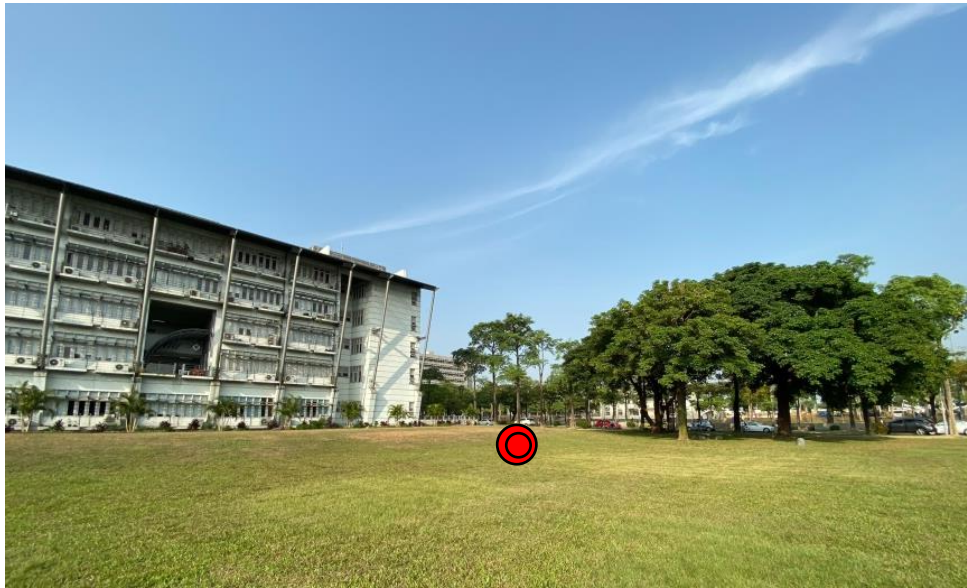
圖 3 、標靶設置區圖示

(二) 各隊伍之水火箭需飛躍設計三館草皮擊中對面設置之標靶區，依靶心往外每直徑 2 公尺設一級距，共設 4 級距，中心 80 分，每往外一級距為 50、30、10 分若無擊中於指定範圍內皆以 5 分計算。若落點於線上，以高分計算。標靶區設置如下：