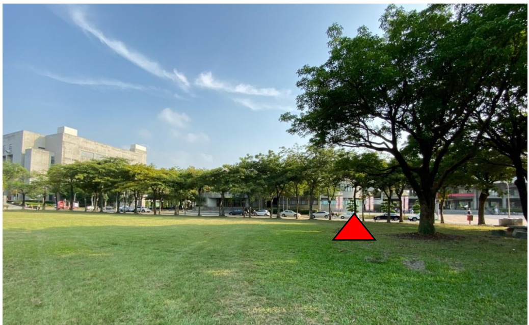
圖 2 、發射區