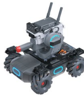
[圖一] 參賽機器人示意圖