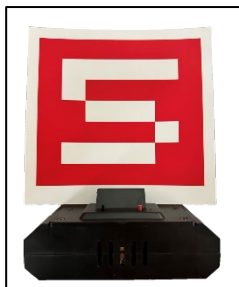
[圖二] 固定標靶示意圖