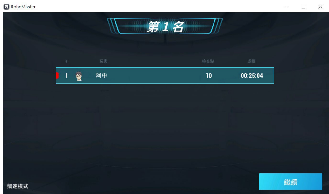
[圖六] 競速模式分數顯示示意圖