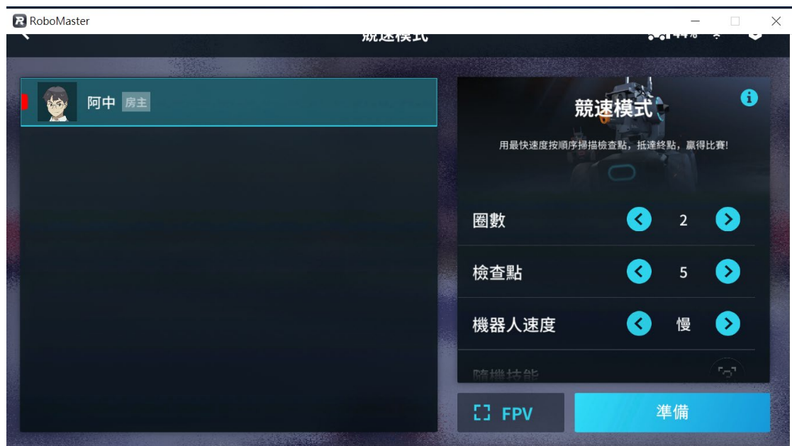
[圖四] RoboMaster程式；競速模式示意圖