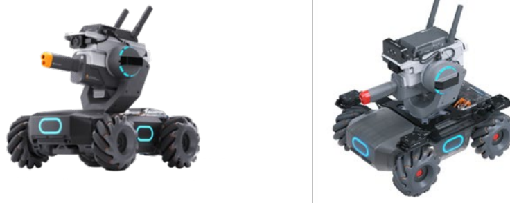
[圖一] 參賽機器人示意圖