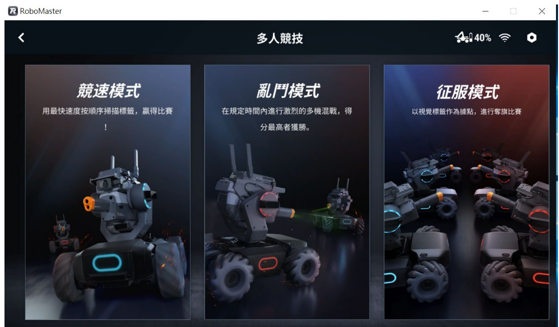
[圖三] RoboMaster程式；競速模式示意圖

(一) 啟動 RoboMaster 程式，進入多人競賽、競速模式。(如圖三、圖四)