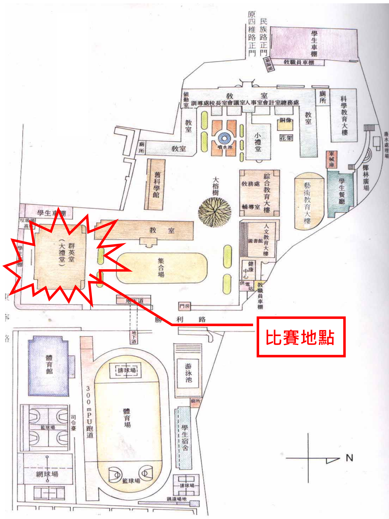
國立臺南第一高級中學校園平面圖