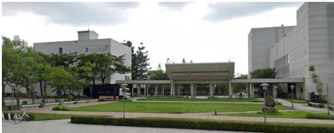
活動草坪前方木紋磚敷地