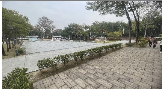
人文廣場上方緩衝平台區