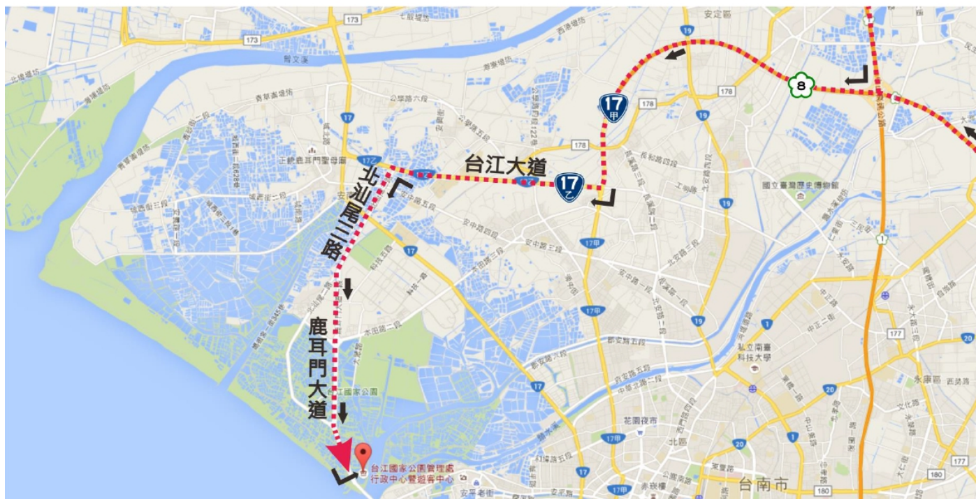
台江國家公園管理處園區示意圖