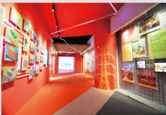
一樓展區入口長廊