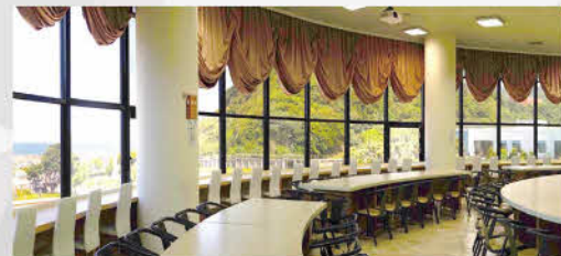
從休息室遠眺自然美景

北部展示館建坪900坪，庭園面積約7700坪，地處北部濱海觀光旅遊線上，背山面海，風景秀麗，交通便捷，並有寬廣的停車空間，無論硬體或軟體皆為一流之設施，來賓可藉由賞心悅目的視聽感受，輕鬆自然的進入電力世界。