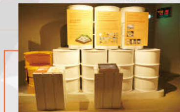
低放射性廢棄物的處置方式