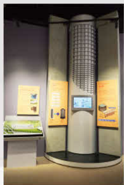
用過燃料的處置方式