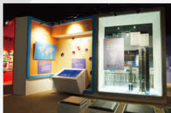
燃料元件與控制棒