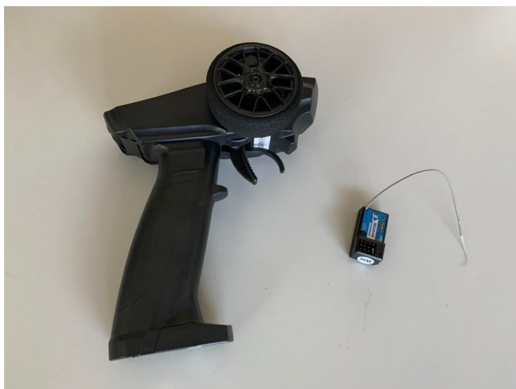
市售 3 通道 2.4GHz 槍型遙控收發器

本競賽禁止使用市售 2 通道、3 通道或多通道之 2.4GHz、27MHz (或其他頻率) 槍型或板型遙控收發器 (或由類似控制元件組合) 作為控制遙控帆船之裝置 (如下二圖所示)，違者以 失格 認定。