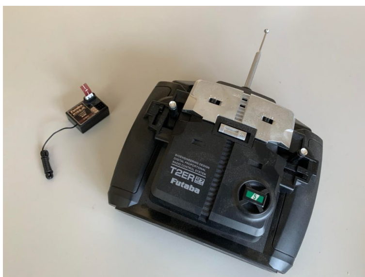
市售 3 通道 27MHz 板型遙控收發器