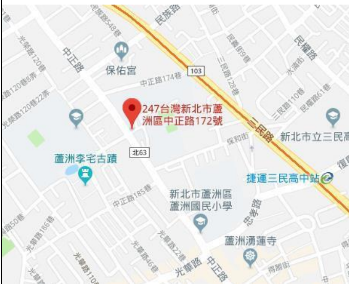
國立空中大學位置圖