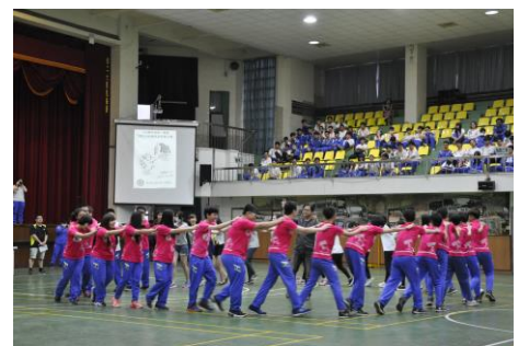
室設一獲得創意校歌比賽第一名

4. 為使每位同學皆能熟練校歌，並凝聚班級向心力，學務組於 5 月 26 日辦理「員生合作教育盃創意校歌比賽」，針對高一各班團隊精神、校歌熟練度及創意