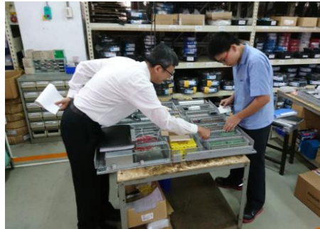
校長與學生討論配線問題

2. 機電整合就業導向專班學生於 5 月 8 日至 6 月 2 日進行為期一個月的就業實習，專班學生白天至職場實習，晚上則回學校上課。校長於 5 月 19 日赴達佛羅企業有限公司關心學生，以了解學生學習狀況及適應問題。