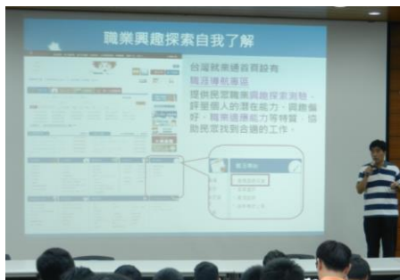
林建業輔導員分享如何找到合適的工作

4. 為使每位同學皆能熟練校歌，並凝聚班級向心力，學務組於 5 月 26 日辦理「員生合作教育盃創意校歌比賽」，針對高一各班團隊精神、校歌熟練度及創意