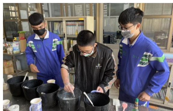
國中學生職涯探索實務體驗營辦理情形

17. 本科 111 學年度應屆畢業生升學 112 學年度大專院校，錄取國立科技大學 75%，升學率 92.86%；就業率 7.14%，表現亮眼。