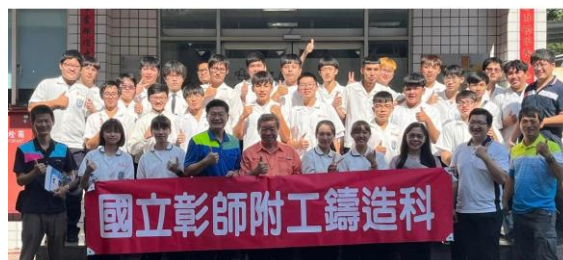
本科 111 學年度應屆畢業生升學與就業