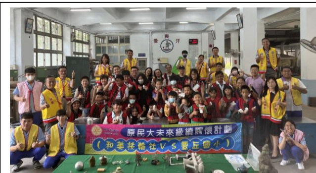
服務師生與和美扶輪社、豐丘國小師生一起合影

16.5月16日和美扶輪社舉辦「原民大未來」活動，本科協辦此活動，與豐丘國小的師生們一起體驗鑄造課程，讓偏鄉的小朋友有個美好的回憶！