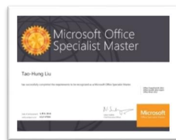
微軟 MOS 國際認證電子證書樣式