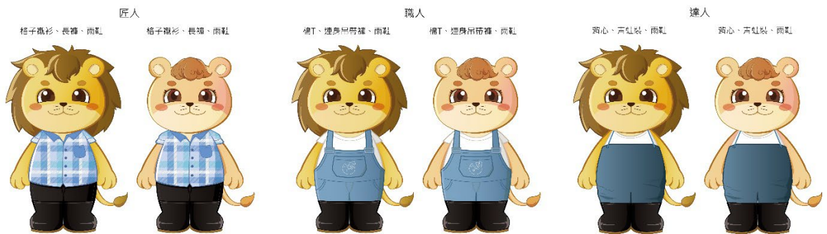
圖 1. 梅克獅圖樣